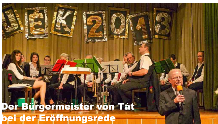
Der Bürgermeister von Tát bei der Eröffnungsrede

Minutenlang stehender Applaus war der Dank an die Künstler, die uns einen hervorragenden musikalischen Einstieg ins Neue Jahr bereiteten.