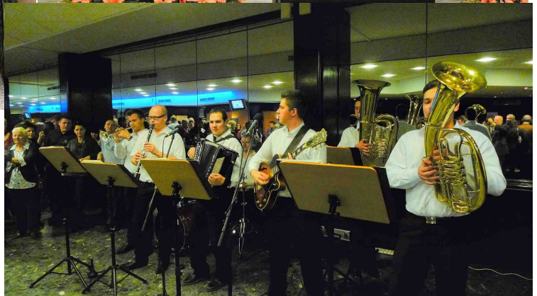
IM FOYER "DIE ADLERSTEINER"