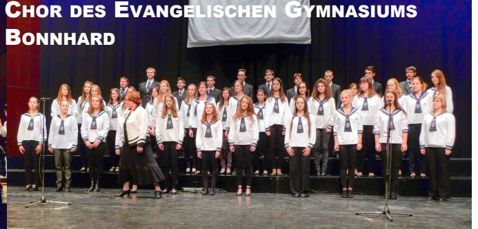
CHOR DES EVANGELISCHEN GYMNASIUMS BONNHARD