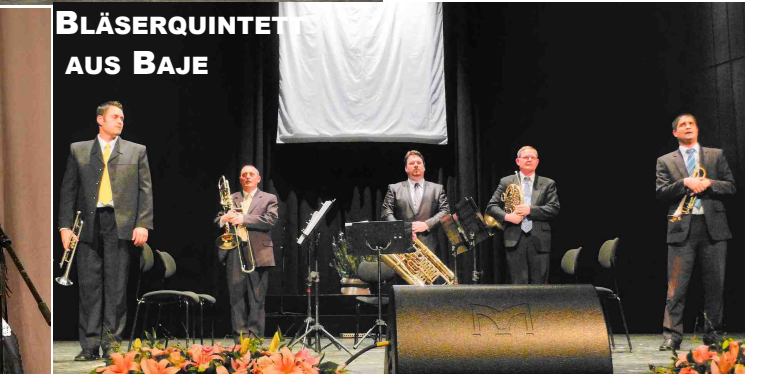
BLÄSERQUINTETT AUS BAJE