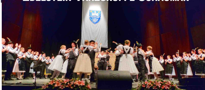
EDELSTEIN TANZGRUPPE SCHAUMAR